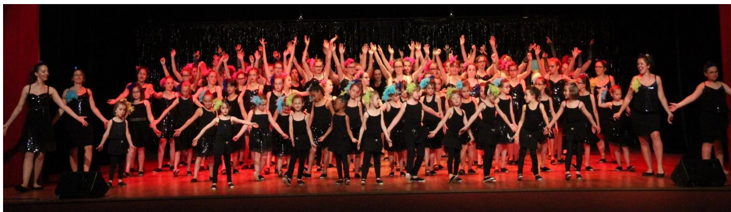
Gala de Danse 2019