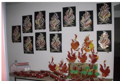
Nos premières réalisations sur le thème du feu

02 43 88 11 30 avec Mme Hérissou pour les élèves de CE1 jusqu'au CM2.